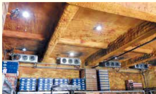
冷蔵庫のクーリングコイルの除霜設備導入を提案

事務所系統の空調設備は個別空調方式でエアコンは順次高効率型に更新中ですが、照明設備のLED化はおおむね済んでいます。 で、冷凍機は順次高効率型に更新していますが、旧型も多数あり、経年劣化による効率の低下・故障も発生しています。 使用状況をリアルタイムで監視する「デマンド監視装置」の設置を提案しました。そうすることで、部分的ではなく全社的に電力の使用状況やタイミングを知ることができ、工夫次第で「契約電力」が下がり「電力消費量」の削減ができます。