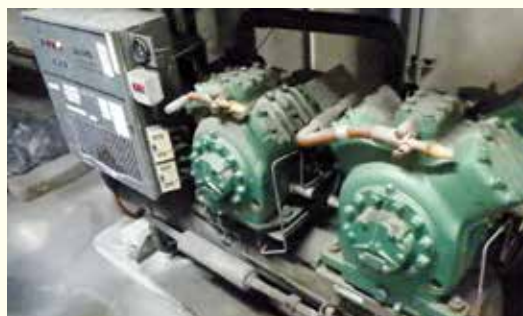
冷凍機は高効率型への更新を提案

見える化と目標値設定 組合の省エネ意識は高く継続的に省エネに取り組んでいますが、具体的な目標値の設定はしておらず、使用状況のグラフ化などの「見える化」が課題でした。そこで、電力の 使用状況をリアルタイムで監視する「デマンド監視装置」の設置を提案しました。そうすることで、部分的ではなく全社的に電力の使用状況やタイミングを知ることができ、工夫次第で「契約電力」が下がり「電力消費量」の削減ができます。 冷凍機はインバーター制御の高効率型に更新することで年間を通し省エネ運転を実現でき、さらに管理標準を作成・活用することで事業所全体のエネルギーバランスの最適化が達成できます。 実施による予想削減金額は年間625万5000円となっています。