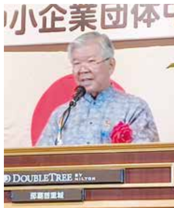
来賓のご祝辞(代読) 大城肇殿 沖縄県副知事