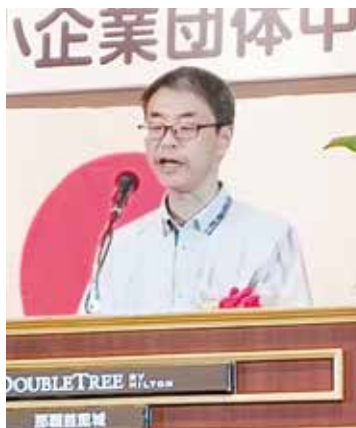
来賓のご祝辞 三浦健太郎殿 内閣府沖縄総合事務局長