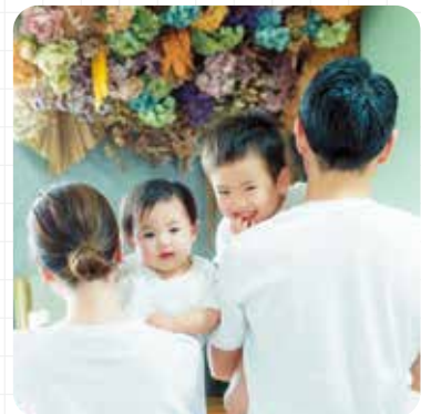
最後までお付き合いいただき、ありがとうございました!!

本連載では、私の育休体験を3回にわたりお伝えしています。最終回となる今回は、育休を取得した経験を通じて私が感じたことについてお伝えします。 育休を取得する前は、仕事の引き継ぎや収入面など、さまざまな不安がありました。「周囲に迷惑をかけてしまうかもしれない」と悩みましたが、実際に申し出てみると、上司や同僚、担当組合の方々が前向きに受け入れてくださいました。業務調整が大変だったものの、周囲の協力のおかげでスムーズに進めることができました。 育休を通じて、子どもの成長を間近で見守ることが、夫婦の協力の大切さを実感し、家事・育児のスキルも向上しました。何よりも以前より家事や育児を担う「当事者意識」が変化したと思います。収入面の不安は、給付金や社会保険料免除など国の支援制度を理解して準備することで軽減できたと感