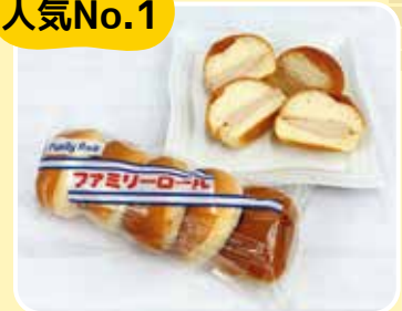
ファミリーロール