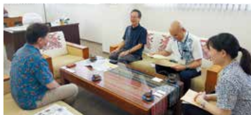
沖縄労働局の方々と意見交換