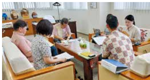
マスコミ懇談会の様子