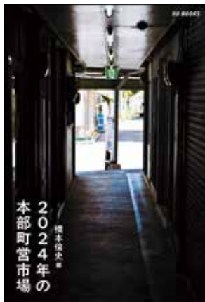
2024年の 本部町営市場