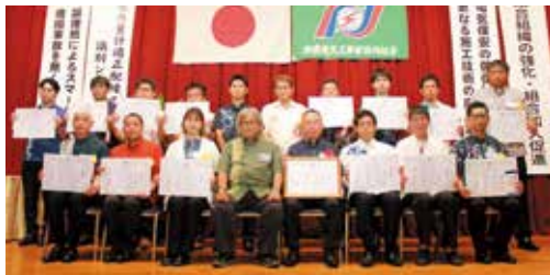
受賞者のみなさま

那覇電気工事業協同組合は、6月2日(月)、沖縄ハーバービューホテルにて、組合功労者・組合員事業所優秀従業員の表彰式を実施しました。これは、理事長から推薦があった役員や、組合員事業所の業務の遂行に功績顕著と認められ他の範となる方を表彰するものです。今回は組合功労者1名、組合員事業所優秀従業員16名、計17名の皆様が表彰されました。受賞者の皆様、誠にありがとうございます。