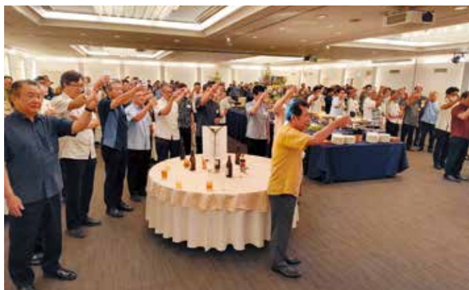
受賞者激励懇親会での乾杯!